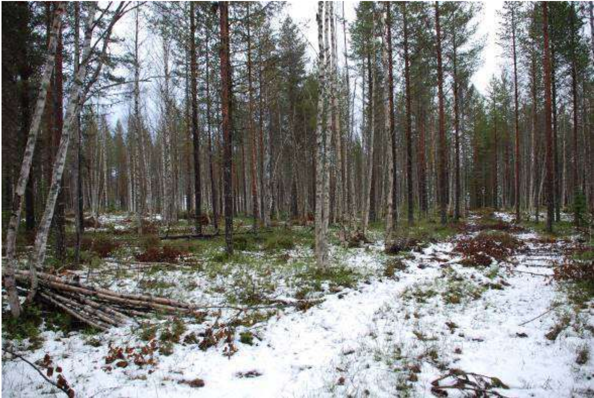
Fäbodvallen är gallrad och man ser att marken har varit brukad.