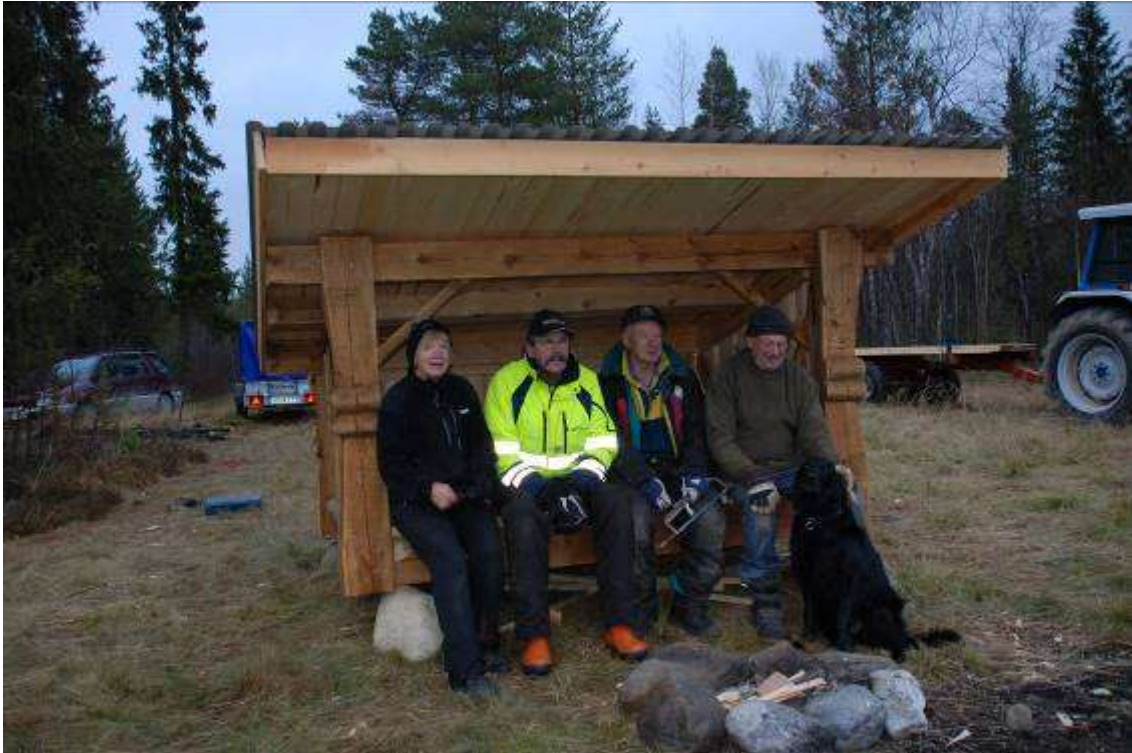
Nöjda byggare efter uppsättningen oktober 2010