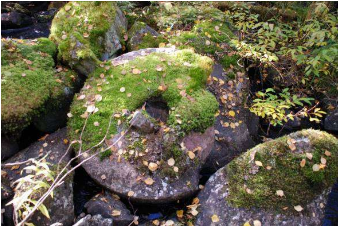
En gammal kvarnsten