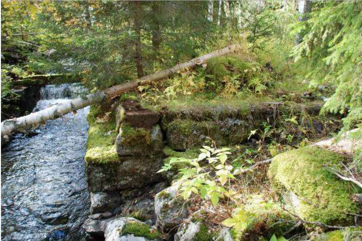
Kraftverksgrunden med stensatt vattenkanal innan den röjdes.