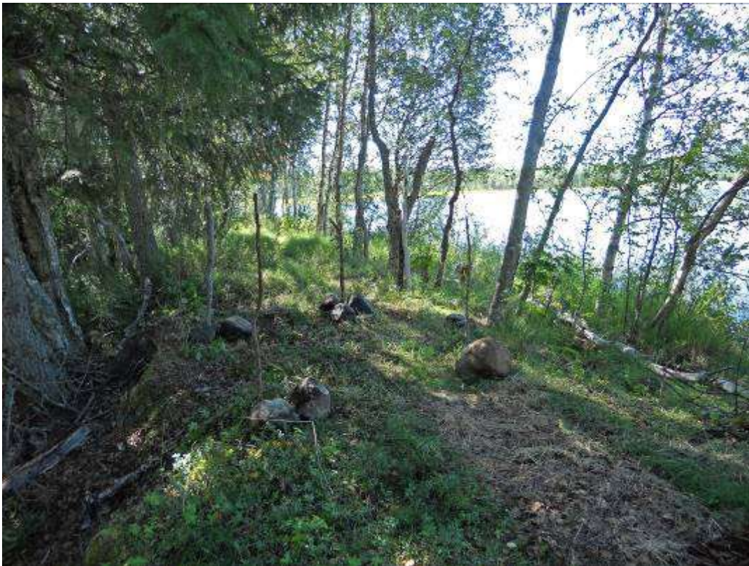
Platsen för skyddet innan den röjdes.