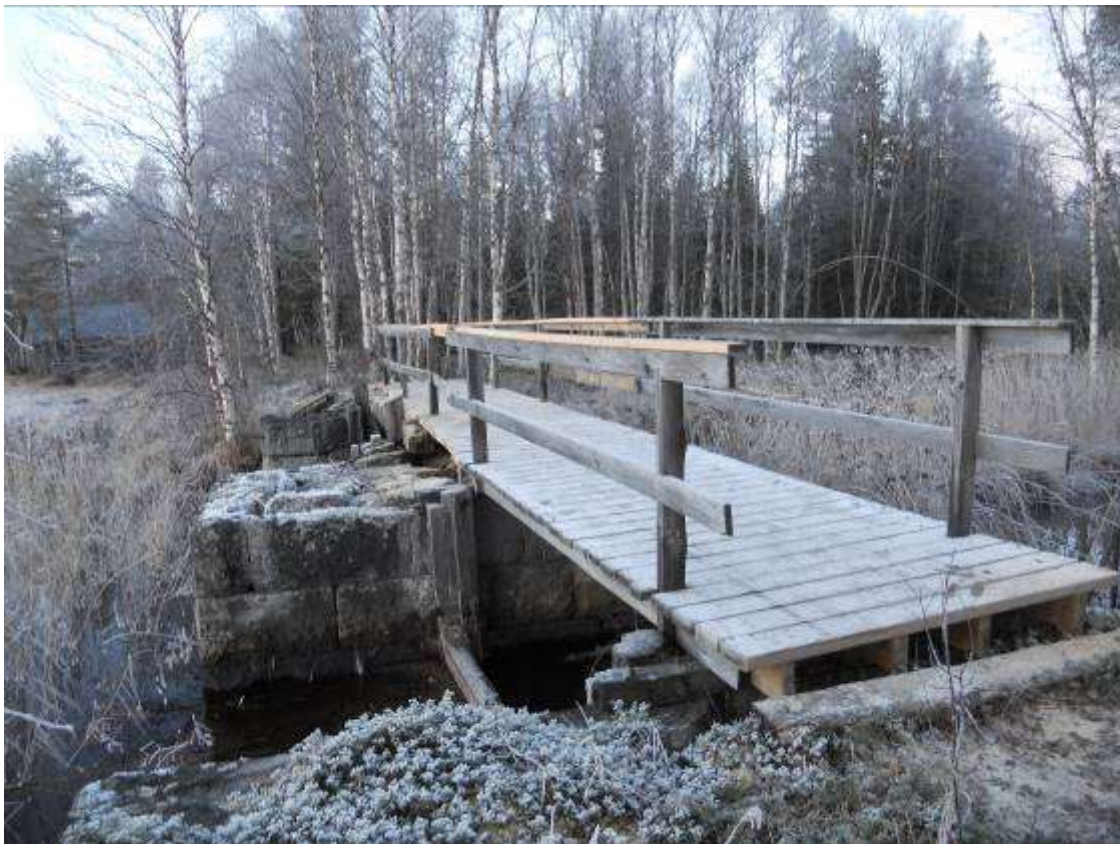
Dammanläggningen med de två utloppen. Brobanorna har byttes ut.