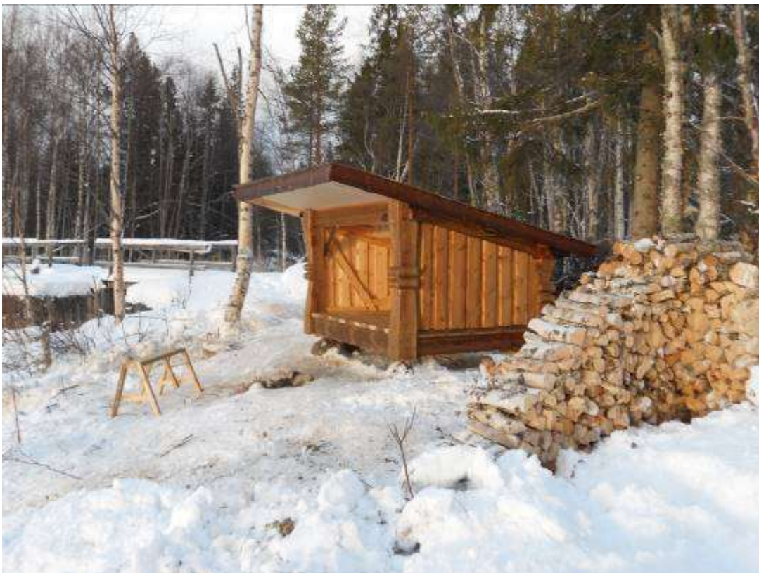
Solen lyser in i skyddet från kl. 14.00 – ett eftermiddagsskydd. Ved från röjningen av dammvallen fraktades till bystugan.