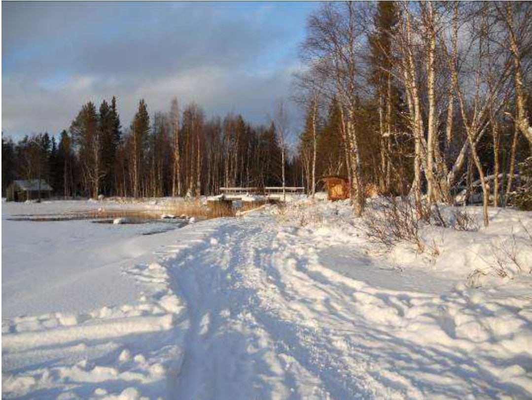
Skyddet ligger i direkt anknötning till dammanläggningen