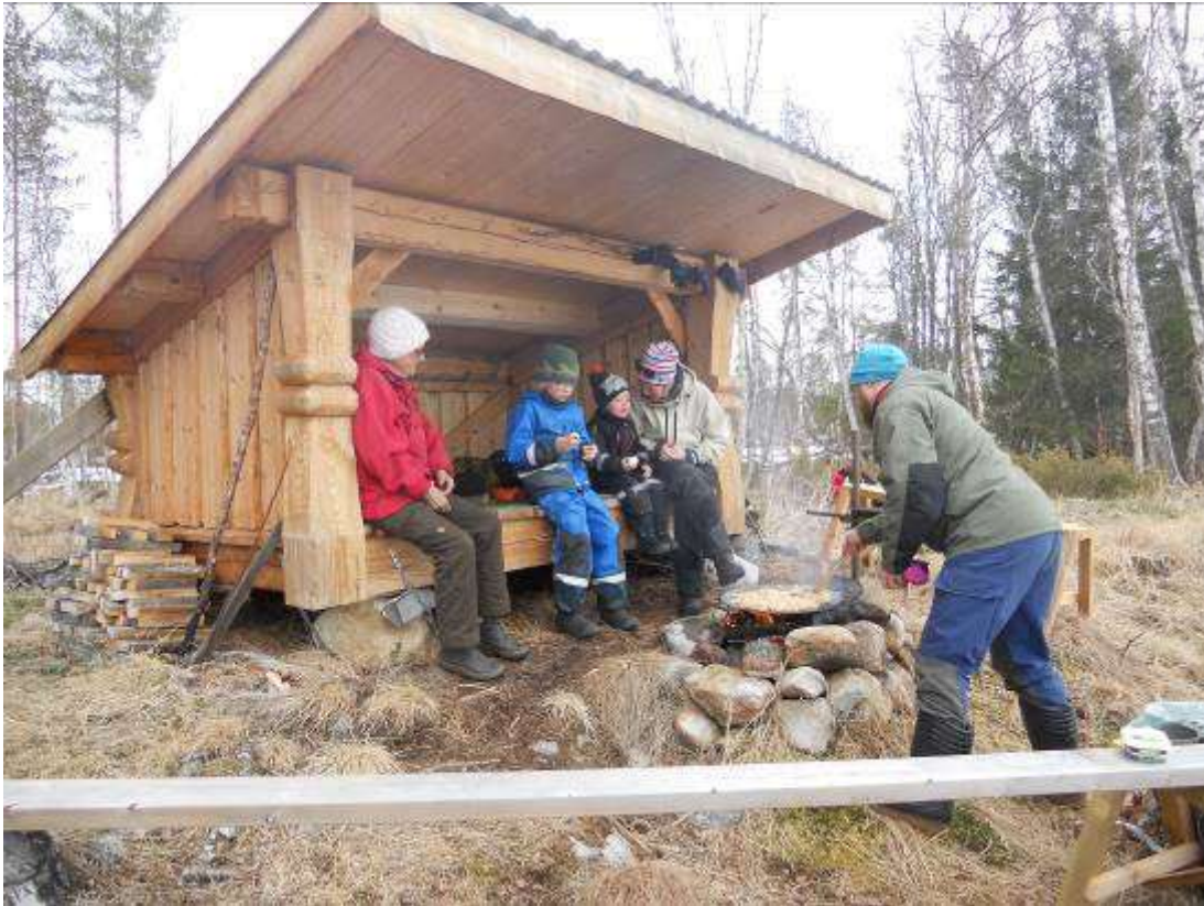
Skyddet står på dammvallen med fin utsikt mot bergen Klacken och Sulan.